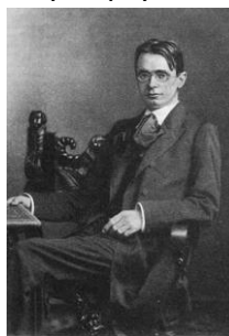
Dr. Rudolf Steiner

To nie wiedza jest najważniejsza, a rozwój osobisty